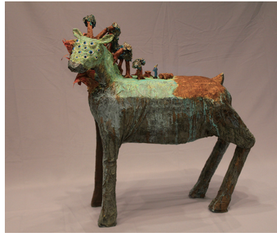
芸術祭彫刻公募展

【彫刻公募展(10月2〜5日)】 応募は13点。入選10点を展示。 高校生の応募、躍進が目立った。 写真は最高賞、宮城県芸術協会 賞を受賞した高校生の作品。題 名は「Earth」。