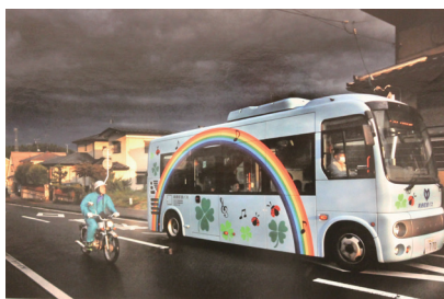
芸術祭フォトサミット in Sendai 2021

【フォトサミット in Sendai 2021(10月2〜5日)】 応募1055点のうち、入賞・入選121点を展示。昨年に比べ点数は減少したが、秀作が目についた。写真は「大賞受賞作品「雨上がり」」。