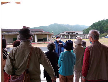
震災遺構の前に語り部の話を聞く参加者

宮城県芸術祭の一環、「文学散歩」が10月7日、非会員を含めて21名が参加して行われた。