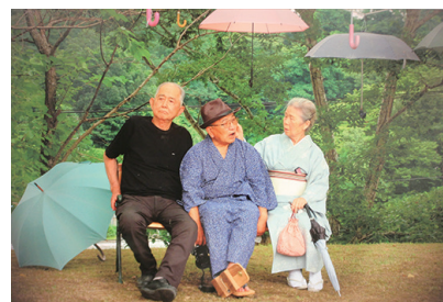
河北新報社賞受賞作品

「巨匠に学ぶ」テーマに討論 フォトサミット in Sendai 2021の関連イベント、写真シンポジウムが10月2日、せんだいメデアターク7階スタジオシアターで開かれた。 昨年に続く2回目の今回のテーマは「巨匠に学ぶ」。フォトサミットの審査員を務めた写真家の赤城耕一氏、元TVプロデューサーの大野克己氏が当協