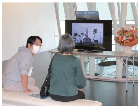
モニターを見る入場者