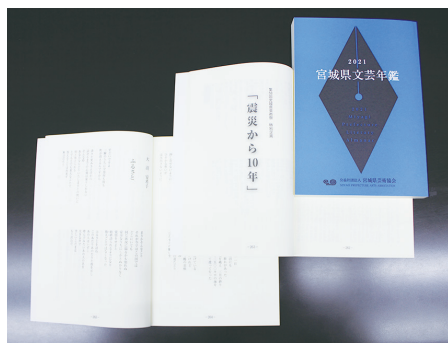
特集を盛り込んだ文芸年鑑

「震災から、10年を振り返って。」(2011〜2021)を企画。関連する写真、動画をモニターで展示した。10年の歩み、変化をそれぞれの切り口で表現。被災地に生きる芸術家の在りようと覚悟を示し、共感を呼んだ。